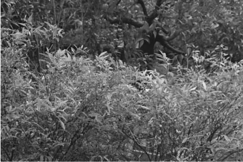
Fig. 2 — Copiosa fruttificazione di Solanum capsicastrum .